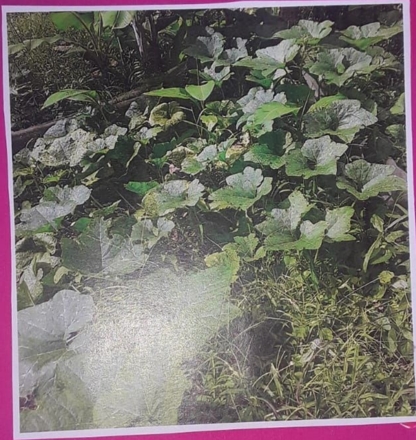
Pepino - ayote.

Siembrá: Se puede cultivar de autoconsumo durante todo el año